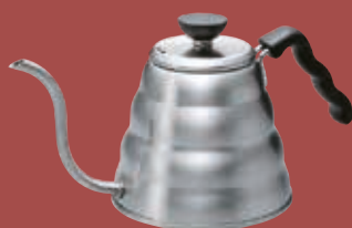
Hario V60 Kettle Buono, 120

Bestil dit Hario bryggeudstyr i dag og skab uforglemmelige øjeblikke ved kaffebordet i julemåneden!