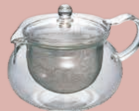
Hario Kyusu Maru Tekande, 700ml