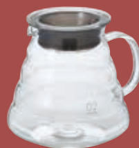
Hario Range Server 60cl. glas